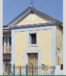
Chiesa di Sant'Alfonso